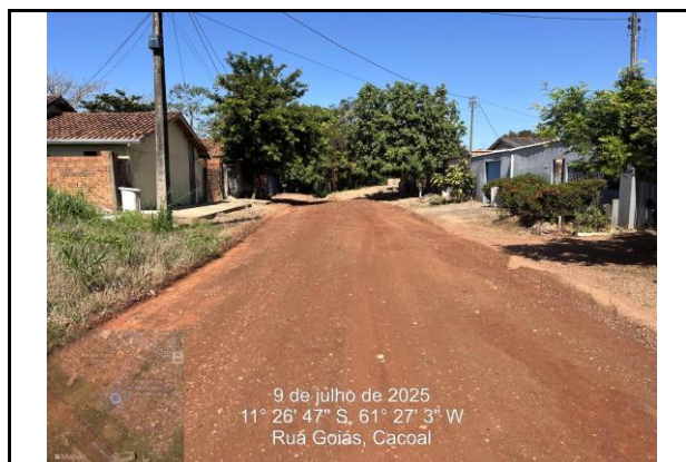
Foto 08 - Captação no meio da quadra da Rua Goiás seguido o Deságue da rede BDTC D=1,20 m