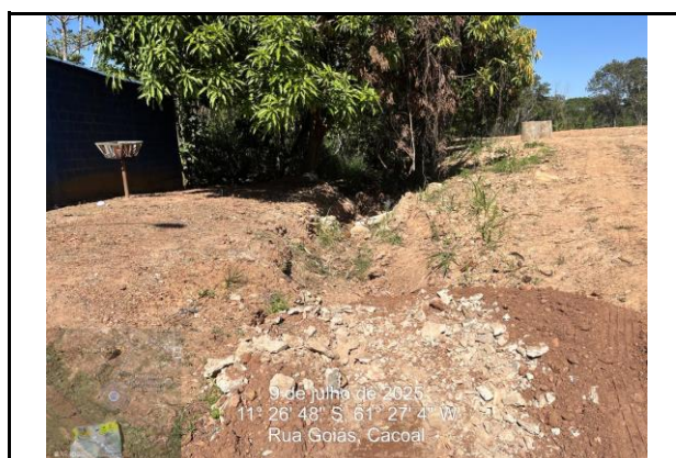
Foto 10- Final da Rua Goiás onde será feito a Boca de Bueiro BDTC D=1,20m