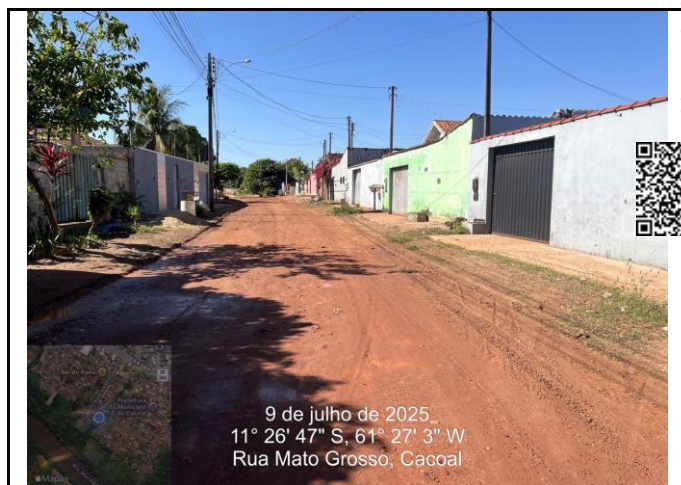
Foto 06 - Esquina entre a Rua Mato Grosso / Rua Goiás onde seguirá a drenagem profunda até Deságue