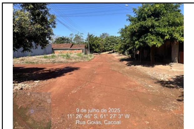
Foto 07 - Ramal de Início da Rua Goiás ligando na Rede BDTC D=1,20m

Objeto: OJETO DE DRENAGEM NA RUA MATO GROSSO- BAIRRO LIBERDADE