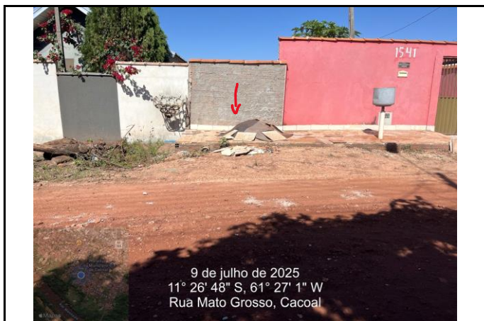
Foto 01 - Ponto de interceptação (PV's) da rede existente de D=1,50 m (rede de D=1,50 que cruza os lotes, passando nesse muro em chapisco) .

Objeto: AMPLIAÇÃO DE META DO CONVÊNIO Nº 111/2020/PJ/DER-RO - PROJETO DE DRENAGEM NA RUA MATO GROSSO-BAIRRO LIBERDADE