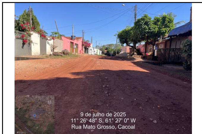
Foto 04 - Ponto mais baixo da Rua Mato Grosso onde partirá a rede BDTC de D=0,40 m até o PV para desague na rede existente de D=1,50m