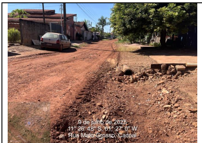
Foto 05 - Ponto de Inicio da rede BDTC D=0,40 m para drenar a agua do ponto mais baixo da Rua Mato grosso até a rede existente de D=1,50 m