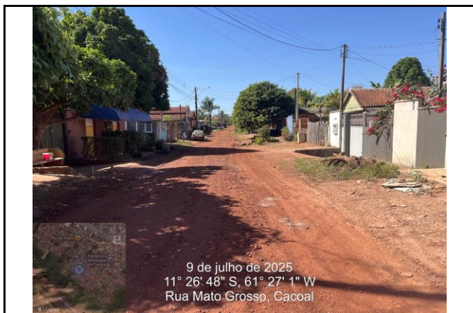
Foto 03 - Sentindo contrário da rede BDTC D=1,20m , mostrando a parte baixa da rua onde irá vir a Rede BDTC D=0,40m