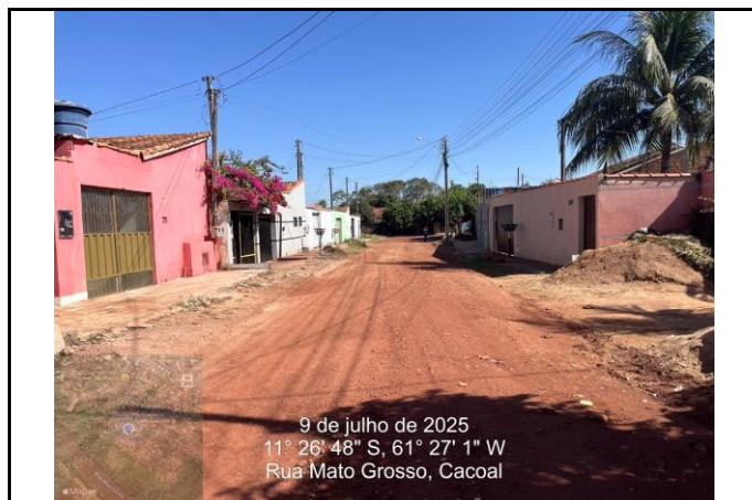
Foto 02 - Ponto de inicio onde seguirá o fluxo da rede de drenagem profunda na Rua Mato grosso para Rua Goiás.