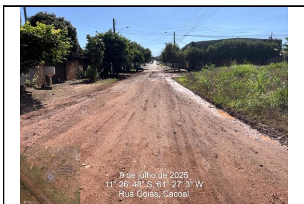
Foto 09 - Captação no meio da quadra da Rua Goiás mostrando de onde está vindo a Rede de BDTC D=1,20m